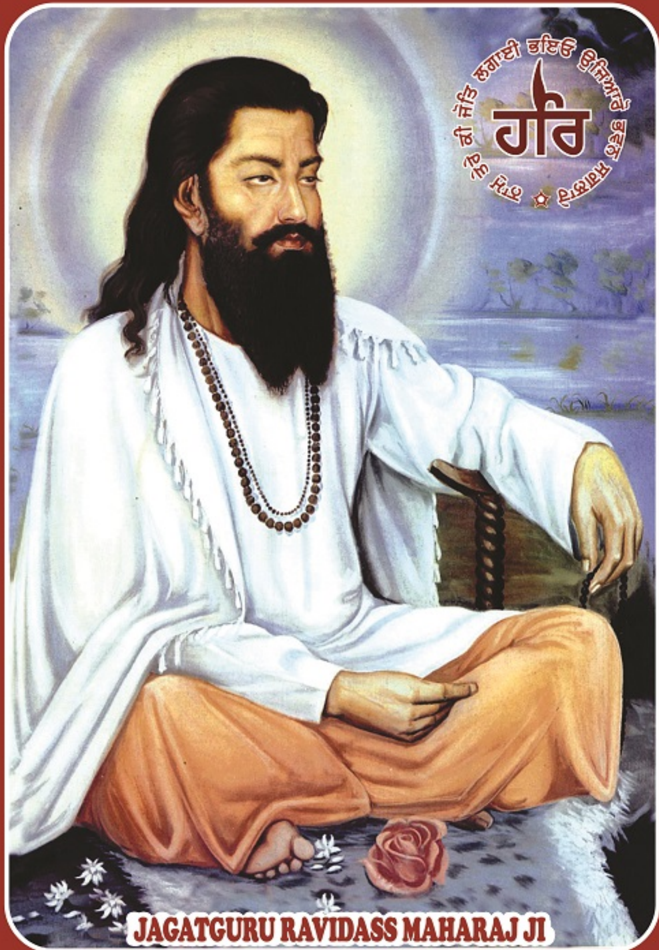
JAGATGURU RAVIDASS MAHARAJ JI